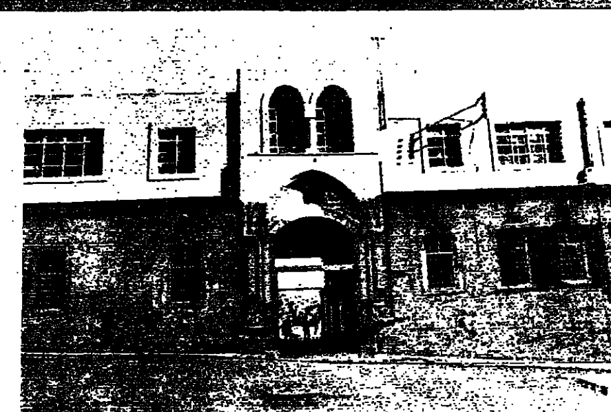
مقر رئاسة الحكومة كما يبدو من الخارج بعد ترميمه